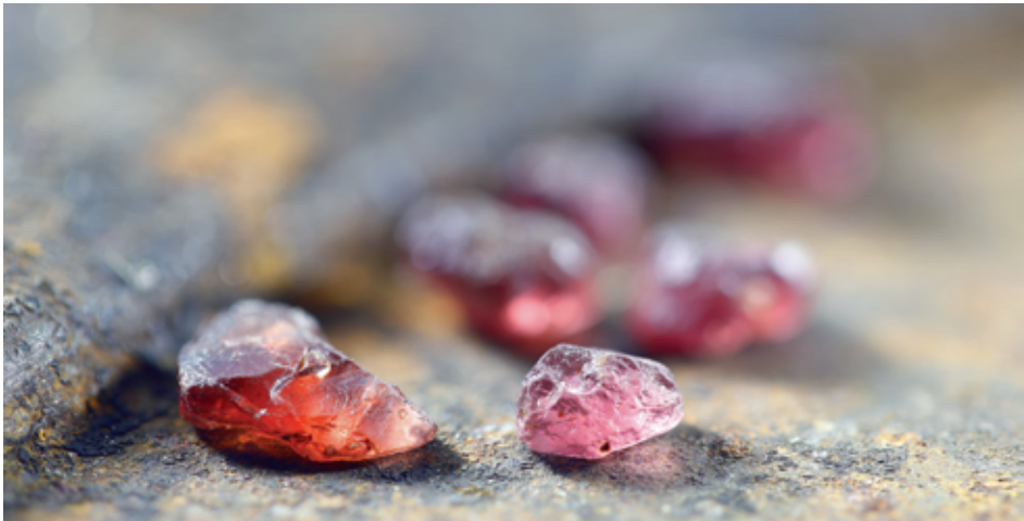
Grenats almandin rouges bruts.

La couleur d'une pierre peut être classique, dite primaire (cyan, bleu, vert, magenta, rouge et jaune) ou être le fruit d'un mélange singulier de couleurs primaires : on parle alors de couleurs tertiaires que sont l'argent, le blanc, le brun, le gris, le marron, l'ocre, l'or et le noir. Il est possible de classer les pierres par grandes familles de couleur, chacune leur conférant une caractéristique particulière.