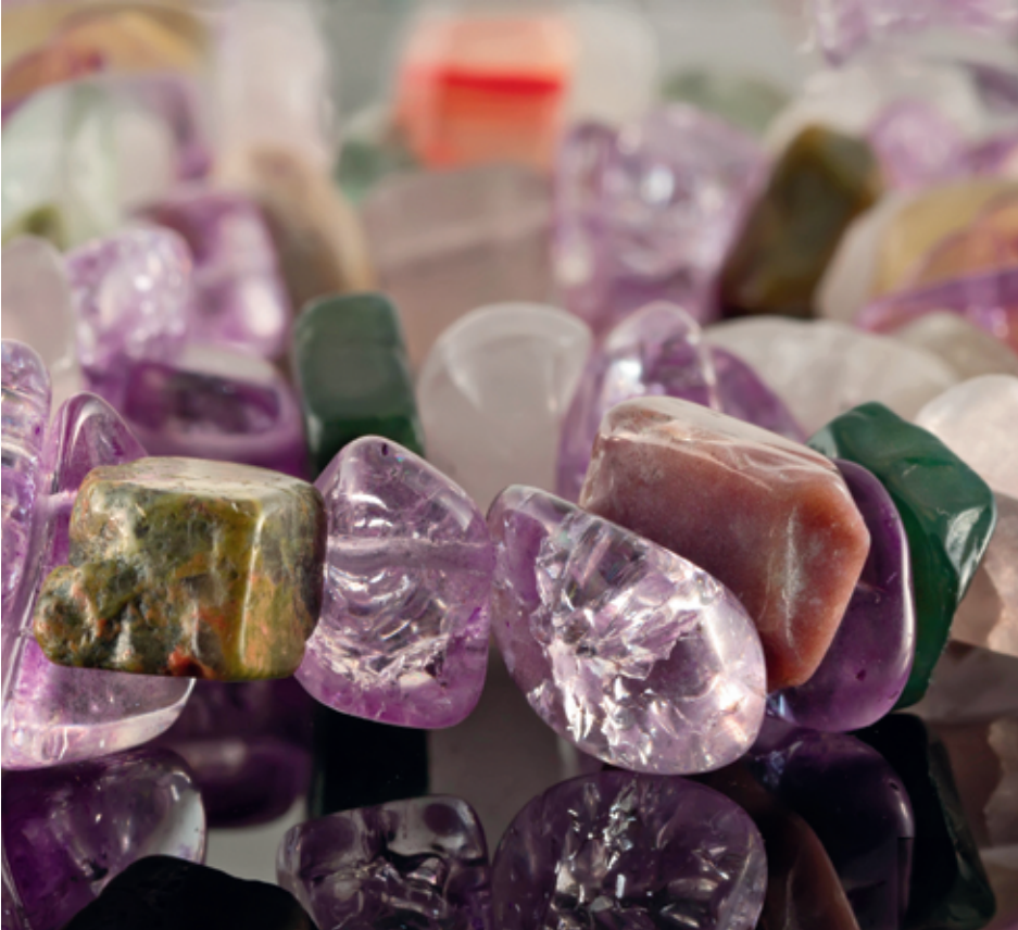
Pierres polies : fluorine, quartz rose, jaspe, cristal de roche, cornaline.

Les pierres que je propose dans ce livre et que je qualifie d'« alliées psychologiques » sont des gemmes (pierres précieuses et fines) ainsi que des pierres ornementales.