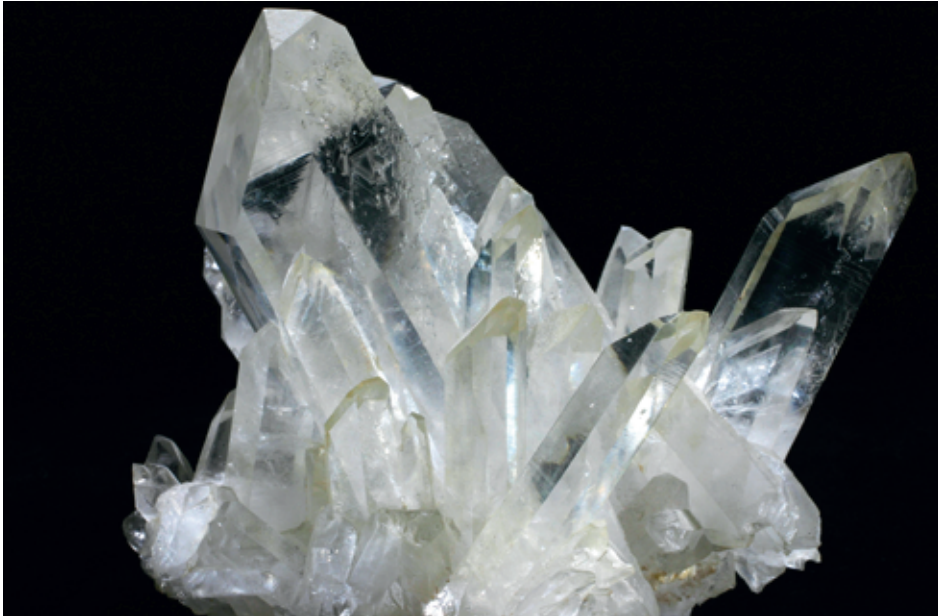
Cristal de roche brut.