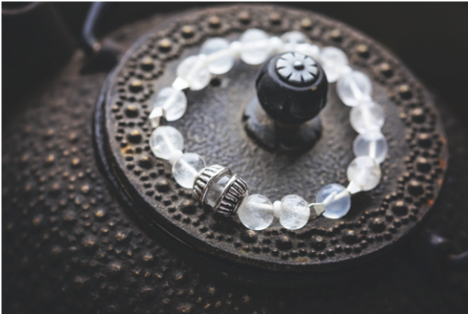
Bracelet en cristal de roche.