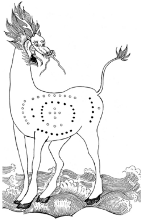
Le cheval dragon, porteur de la carte du fleuve Jaune ( hetu ).

Fuxi aurait découvert également les huit trigrammes ou bagua . Le bagua est une figure octogonale composée de huit trigrammes ( ba signifiant « huit » et gua « trigramme »). Chaque trigramme est composé de trois traits superposés pleins (yang) ou coupés (yin).