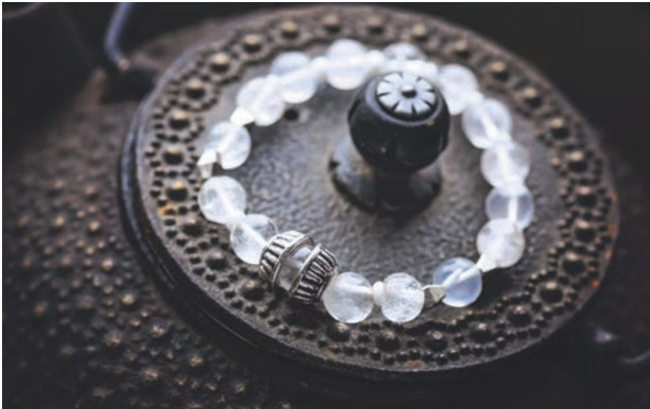
Bracelet en cristal de roche.