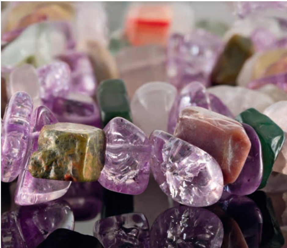
Pierres polies : fluorine, quartz rose, jaspe, cristal de roche, cornaline.

Les pierres que je cite dans ce livre, véritables alliées énergétiques, sont des gemmes (pierres précieuses et fines) ainsi que des pierres ornementales.