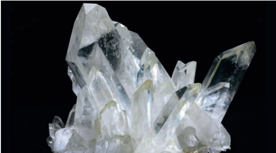
Cristal de roche brut.