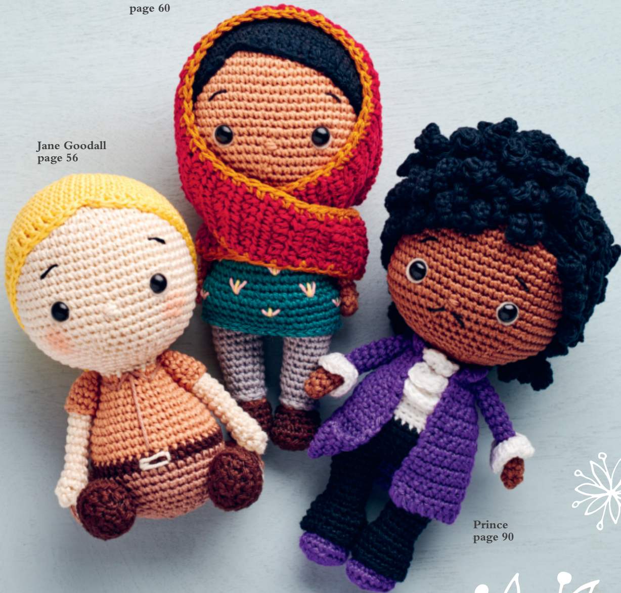
Prince page 90