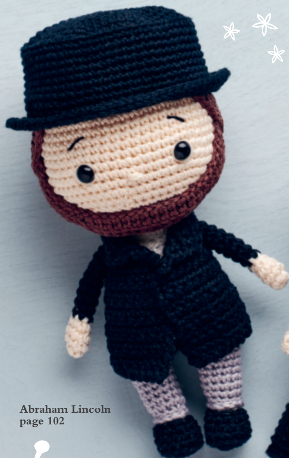
Abraham Lincoln page 102