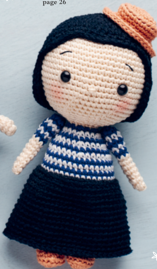
Coco Chanel page 26