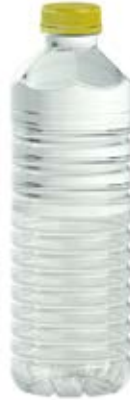
l' acide citrique